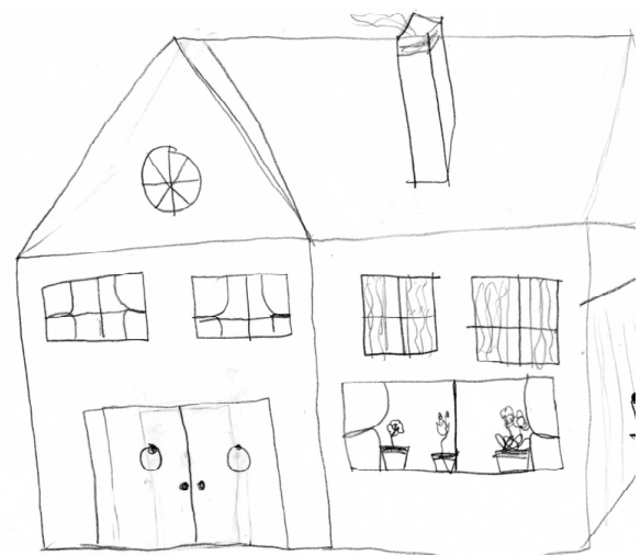
Figura 2 Dibujo de la casa